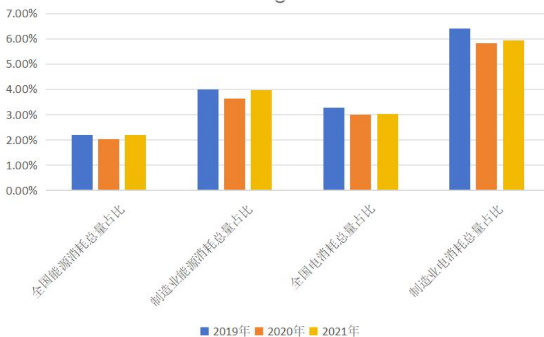
图 2.近几年纺织行业能源占比情况

虽然纺织行业的能源消耗量较大，但在全国能源消耗总量和制造业能源消耗总量的占比较低。2019 年-2021 年，纺织行业能源消耗总量在全国能源消耗总量的占比和在制造业能源消耗总量的占比可见图 2。